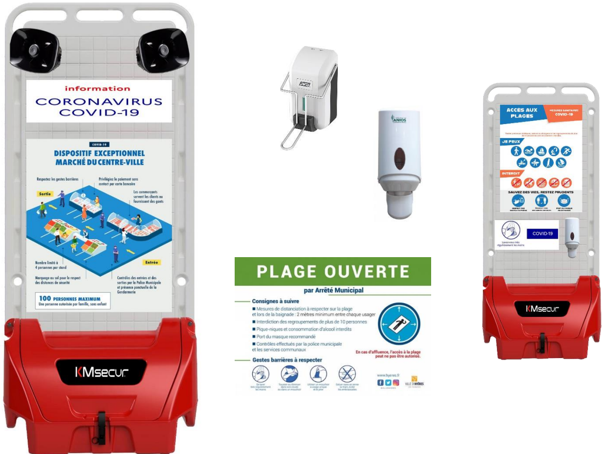
Hauteur 1m70 largeur 0,8m

Le panneau sanitaire pour Module D-WILDS permet de diffuser des messages vocaux de rappel de consignes de manière répétée suivant une programmation personnalisable (par exemple toute les 10min du lundi au vendredi de 8h à midi).